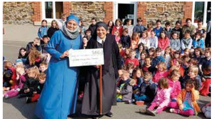
ÉCOLE SAINTE ANNE D'ÉTABLES, RÉSULTAT DE LA COURSE SOLIDAIRE

au parcours exceptionnel et au travail exemplaire.