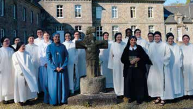
ABBAYE NOTRE DAME DE BEAUFORT